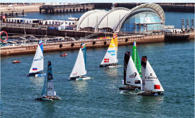
青岛国际奥林匹克帆船中心